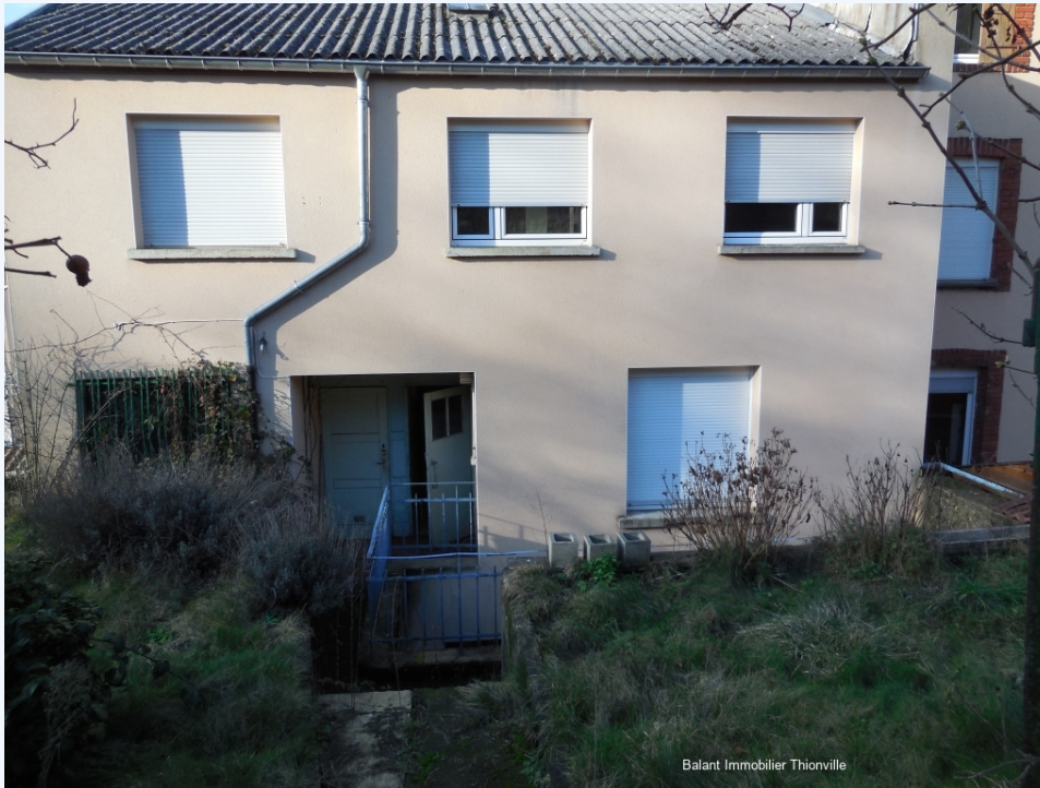
Balant Immobilier Thionville